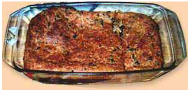
obr. 5. Ukázka hubníku

hubníky - propagační materiál všech stravovacích zařízeních nabízející „hubníky“.