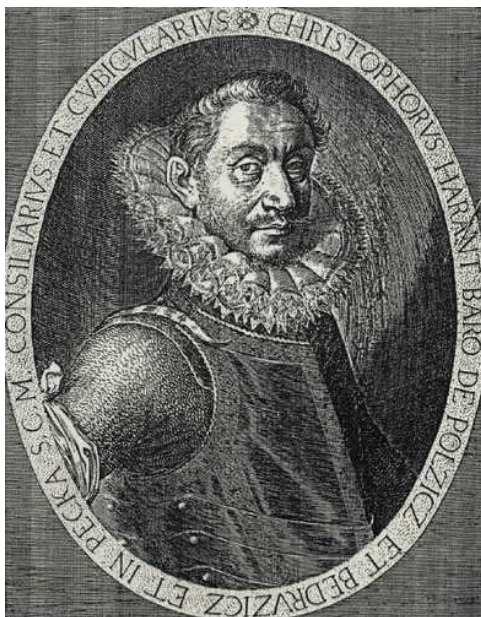
obr. 3. Kryštof Harant z Polžic a Bezručic

Na straně druhé využít názory Kryštofa Haranta (zjistit zaměření jeho cestopisu - vztah odlišných náboženství, dobrodružství, evropanství?).