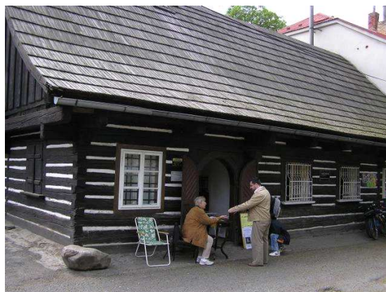
obr. 2. Jindřich Mošna (vlevo), Stará hospoda – muzeum herce Jindřicha Mošny (Dobřív)