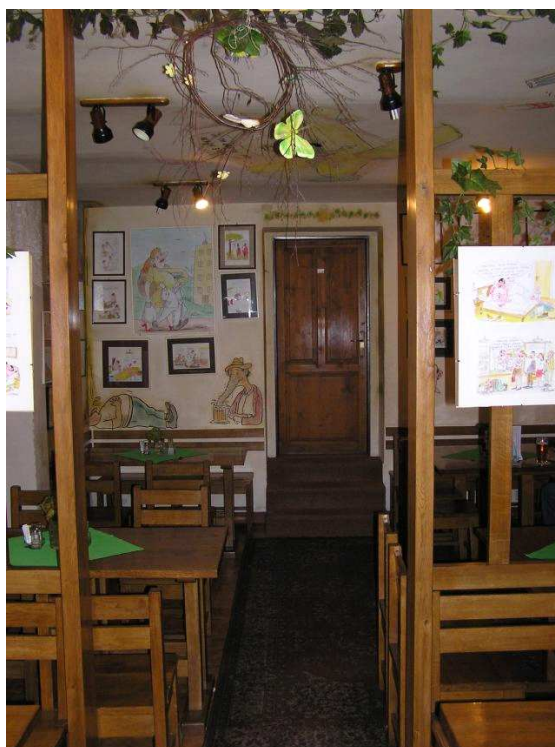
obr. 6. Smržovka – Pivrcova hospoda