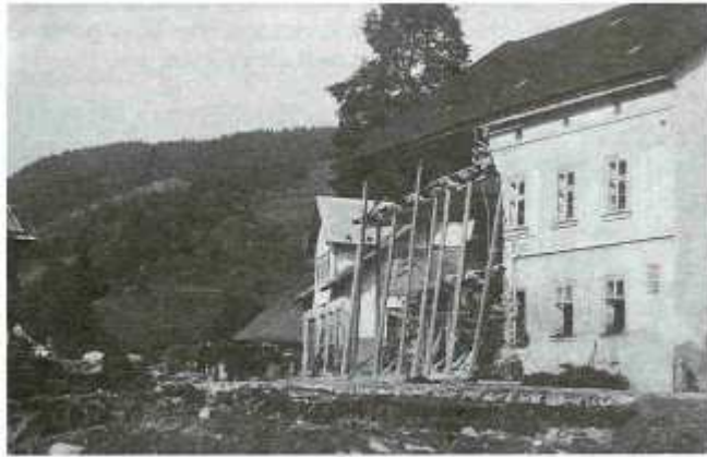
obr. 5. Trosky známého hotelu „Eger“.