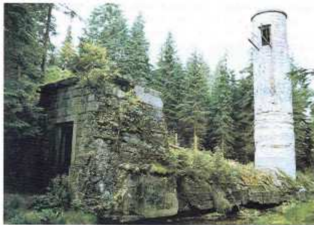
obr. 3. Výpustná štola na vzdušnej strane a šoupátková šachta (1916 a 1996)