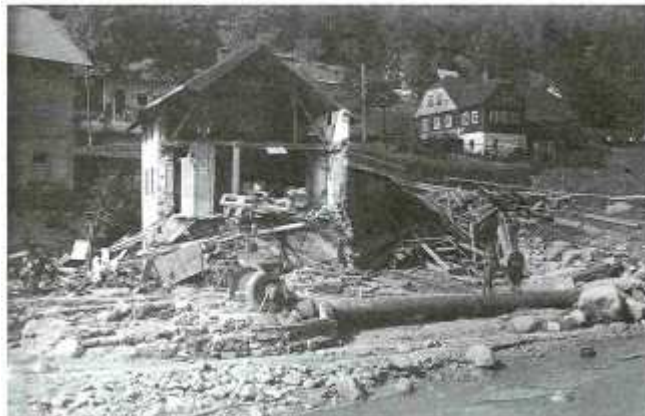
obr.4. Trosky brusírny skla fy E. Simm