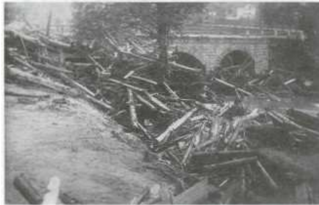
obr. 6. Most příjezdní komunikace k desenskému nádraží