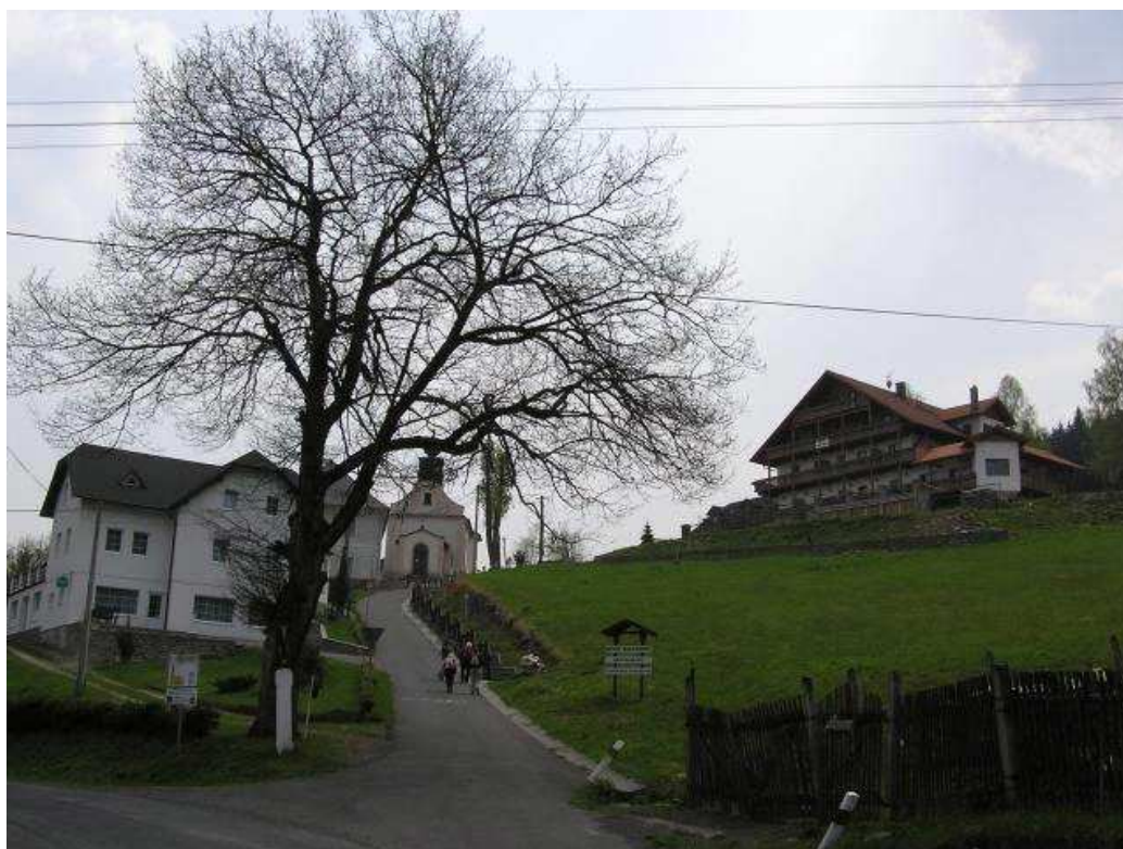
obr.8. Hamry – centrální část obce

- stravování, ubytování, program workshopu