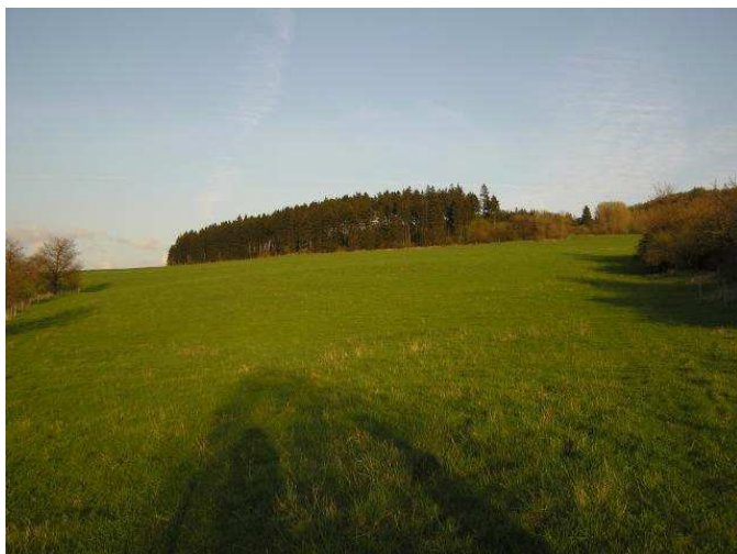
obr. 1. Třebel – místo bitvy v roce 1647

Existují historické dokumenty a bitvě (systémy opevnění, vojenské strategie této doby). S vojenskými historiky více rozpracovat taktiku, průběh bitvy, lokalizovat jednotlivá stanoviště.