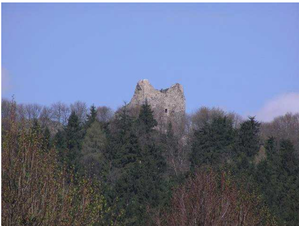
obr.7. Hrad Přimda